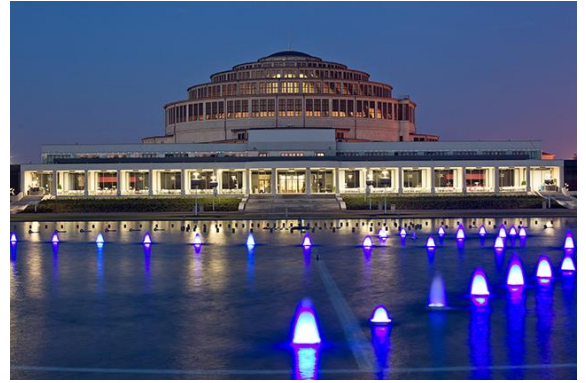
Hala Targowa, le marché couvert de la ville

vaste place centrale dessinée en 1241, est le cœur de la ville médiévale. Elle est bordée de maisons à l'origine gothiques, remaniées plus tard dans les styles renaissance, baroque ou classique. Wrocław détruite à 70% à la fin de la guerre, la plupart des jolies maisons aux tons pastel du Rynek ont été restaurées après 1945.